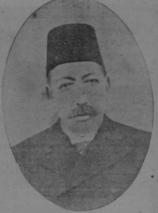
EL SULTAN DE TURQUIA