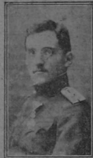
EL PRINCE ALEJANDRO

dose de las dificultades de Turquía han enviado tropas a la frontera. No les permitiremos que tomen una pulgada del sagrado suelo turco. Debemos pelear con valor y coraje por las