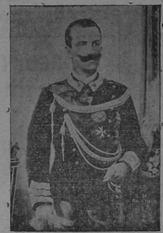
EL REY VICTOR MANUEL