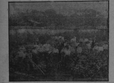
Los alumnos en el Campo de Ensayos Agrícola-Escolar.

Seguiré informándole por partes acerca del adelanto y mejora en nuestras escuelas, y ahora que están próximos los exame-