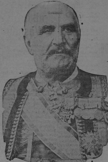
EL REY NICOLAS DE MONTENEGRO

CONSTANTINOPLA, 14.—Informan que los refuerzos turcos redimieron a Berana. El comandante militar de Scutari dice que los turcos recuperaron las alturas que circundan a Gusinje, cerca de la frontera montenegrina, al noroeste de Padgorizza. Anoche los búlgaros volaron dos puentes entre Istip y Kotschana según telegrama de Utkup.