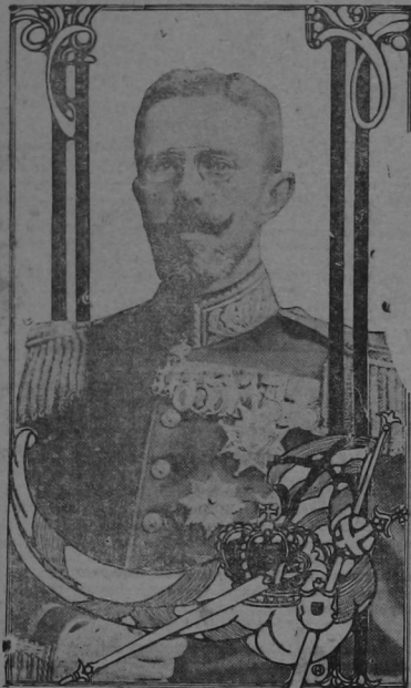
EL CZAR DE BULGARIA FERNANDO I.

Esta agitación puede provocar un terrible conflicto europeo.