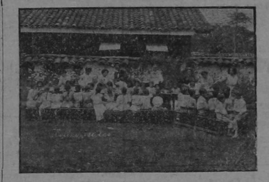
Los alumnos almorzando en la Cocina Escolar.

criaba, que en nada me parece que sea la misma cosa esa escuela y en la que a mí me enseñaron. Vi allí dos hermosos cuadros cultivados de papas; uno de ellos sembrado según la costumbre seguida por los agricultores antiguos, a mejor dicho, según la rutina; y el otro cultivado según las prácticas modernas ó sea científicamente y allí se ve materialmente la utilidad de la escuela; la conveniencia de dotarlas de lo necesario; la competencia de sus maestros, y lo que aún es más: la importancia de que los Inspectores sean como el señor Rojas, entusiastas, cumplidos y amantes del progreso.